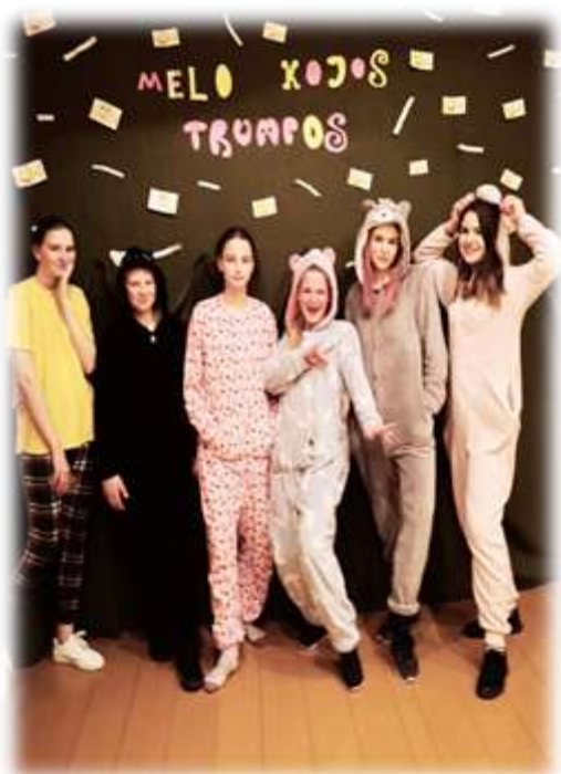
Nuotraukoje mokytoja su buvusia mokinių savivaldos komanda Širvintų r. Gelvonų gimnazijoje. Kadras iš vykusios nakvynės mokykloje.

- Manau, kad tai vienas iš darbų, kuris reikalauja labai daug kantrybės. Juk ir mokytojams būna sunkių dienų, kai nėra nuotaikos, kai nieko nesinori, kai sunku valdyti emocijas, o prieš jį sėdi dar daugiau tokių, kurie tik pradeda save suprasti. Jie visi skirtingi, turintys savo nuomonę, pastebėjimus, nuotaikų kaitą ar tiesiog norintys ramiai pabūti su savimi. Nepaisant to, mokytojas privalo užsidėti puikios nuotaikos kaukę ir nepriekaištingai suvaidinti, kad pamoka būtų sklaidi bei visi suprastų pateikiamą informaciją. Dažnai mintimis tenka grįžti į tas akimirkas, kuomet pati buvau mokinė, kad geriau juos suprasčiau. Tačiau labai tuo džiaugiuosi, nes šis darbas pripildė mane kantrybe ir išmokė tinkamai valdyti emocijas.